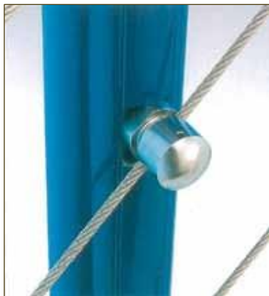
ASS serre-câble de fixation