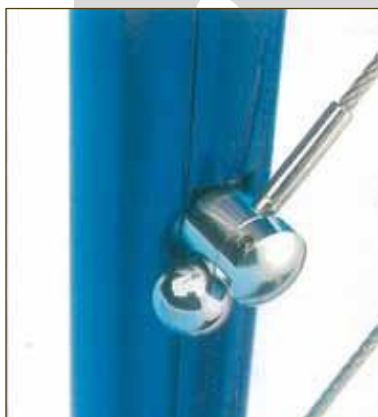
ASS Serre-câble de fixation d'extrémité